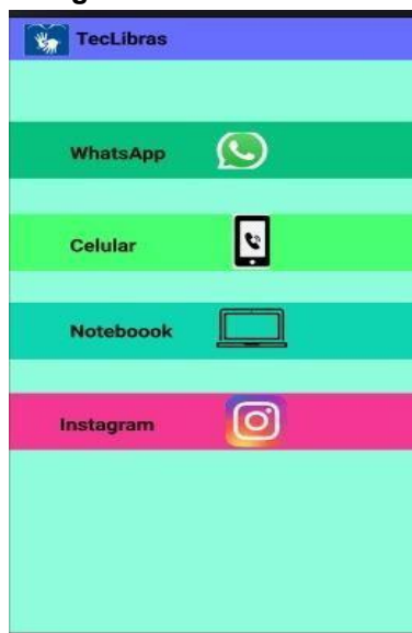
Figura 2 – Tecnologias com tutoriais acessíveis no app

Quando o usuário clicar no botão "Comece Aprender Agora", será apresentado um menu de ferramentas tecnológicas, como por exemplo o Whatsapp , Instagram , ferramentas de acessibilidade do celular e notebook , etc.