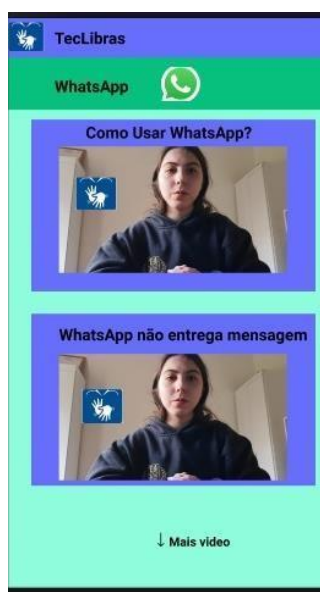
Figura 3 – Videotutoriais acessíveis (libras) da tecnologia selecionada

Cada uma das tecnologias terá seu próprio botão, composto do seu nome e do seu símbolo representativo. Ao escolher sua ferramenta, o usuário será redirecionado para outra tela com uma lista de vídeos e os títulos com palavras simples de se entender, como por exemplo "como mexer Whatsapp ?" "problemas erros Whatsapp ". Apesar de estranhas, essas duas expressões são de mais fácil entendimento para a comunidade surda, pois muitos deles ainda têm bastante dificuldade com a língua portuguesa (como o uso de conjunções, por exemplo).