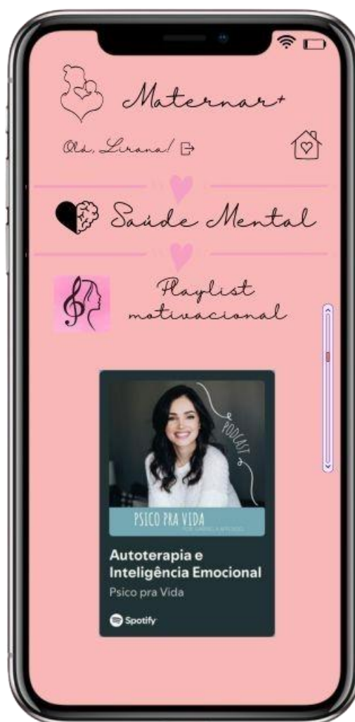
FIGURA 12: "Playlist Motivacional" sobre saúde mental

Conforme apresentado na figura 12, esta playlist foi selecionada para dar um momento de motivação e reflexão. Denominada " Autoterapia e Inteligência Emocional ", é um podcast com uma psicóloga que traz uma reflexão e terapia. A imagem da tela leva à usuária ao aplicativo do Spotify para acessar o podcast.