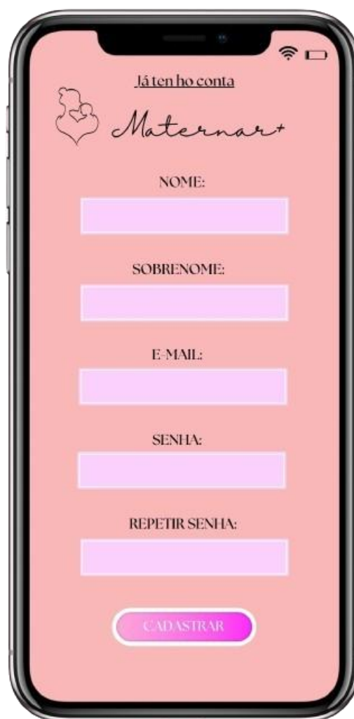
FIGURA 3: Tela de cadastro para novas usuárias

A Figura 3 ilustra a página de registro do aplicativo Maternar+, mantendo o mesmo estilo delicado e acolhedor das demais interfaces, que enfatiza a proposta emocional direcionada às mães.