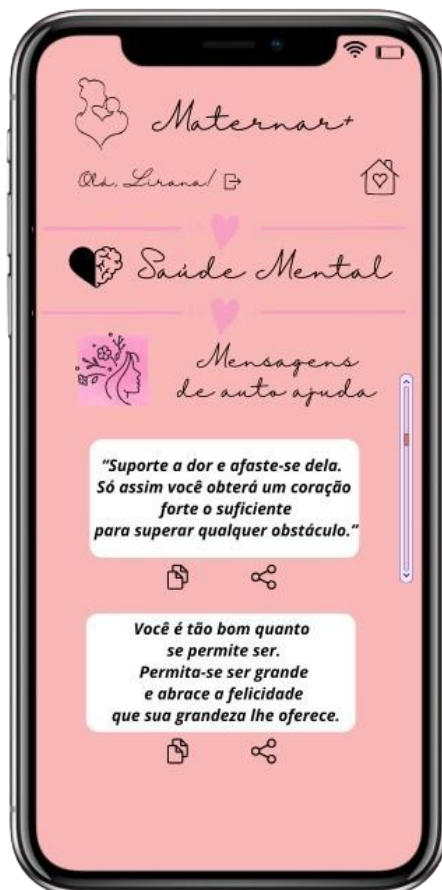
FIGURA 11: Tela “Mensagens de auto ajuda

Nesta figura 11 a usuária tem disponível várias mensagens de reflexão e auto ajuda, onde a mesma pode copiar a mensagem e compartilhar em suas redes sociais. Conforme desce a tela há uma grande lista de mensagens motivacionais e inspiradoras.