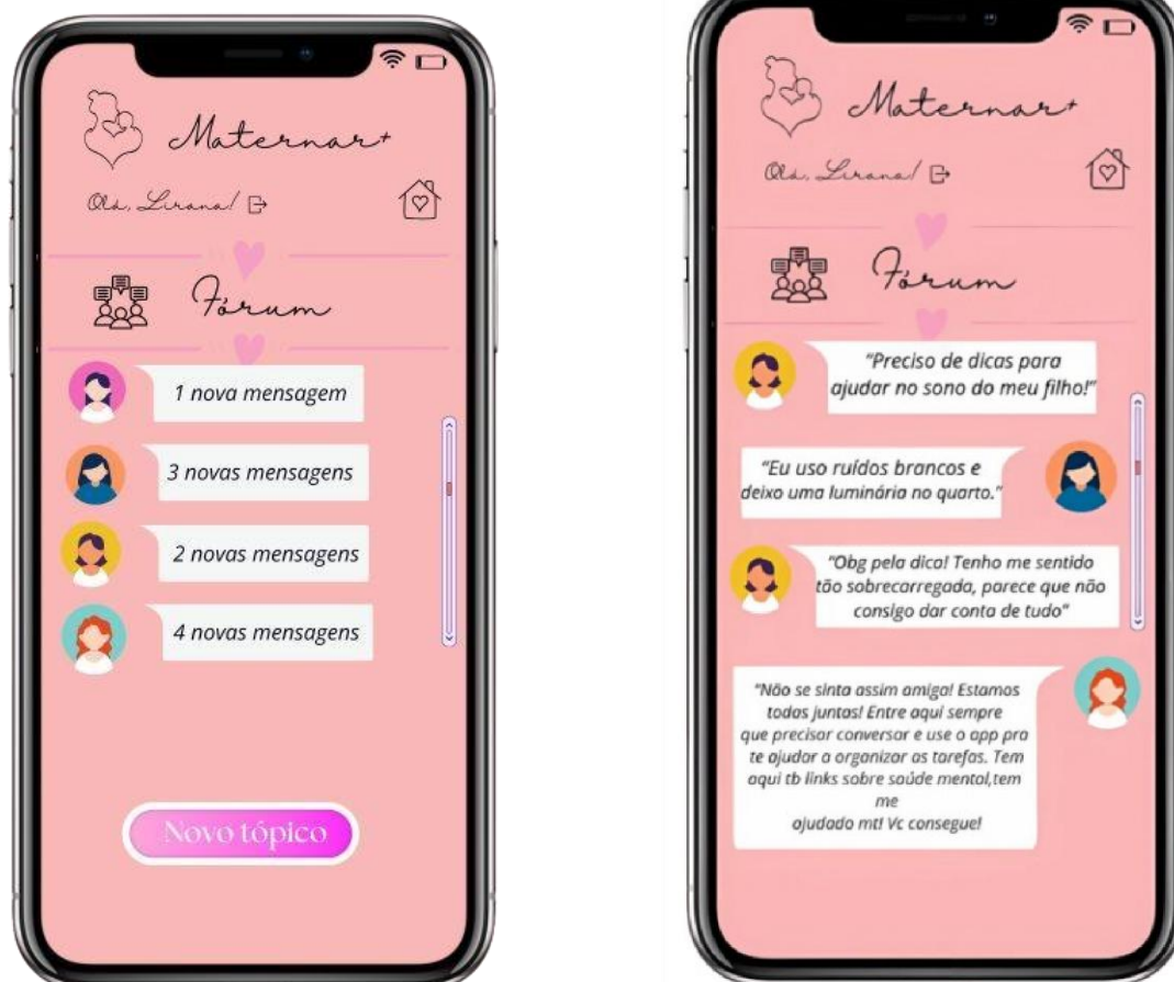
FIGURAS 8 e 9: Telas do fórum do aplicativo

Na parte inferior da tela há botões importantes para a funcionalidade do app. Um deles é “Adicionar nova tarefa” onde a mãe cadastra mais uma tarefa na lista e o botão “Enviar tarefa pendente por e-mail”. Nesta parte através do e-mail cadastrado as tarefas que estão pendentes serão enviadas para o e-mail da mãe, servindo como um lembrete para realizá-las.