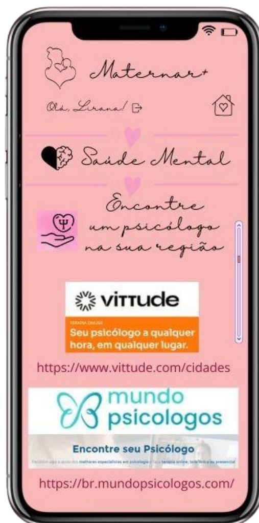
FIGURA 13: Tela “Encontre um psicólogo na sua região”

Aqui nesta tela da figura de número 13 podemos observar a interface com links de sites que servem como busca de profissionais nas cidades do Brasil. Através destas buscas a mãe que necessita procurar um psicólogo pode acessar para ver se em sua região encontram-se profissionais disponíveis, alguns gratuitos ou com custo por consulta.