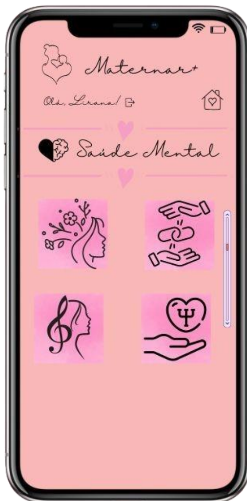
FIGURA 10: Menu da parte “Saúde Mental”

Na figura 10 consta o menu onde a usuária terá acesso a diversas funcionalidades relacionadas à saúde mental, tema de muita importância na maternidade. Abaixo uma breve explicação sobre os ícones: