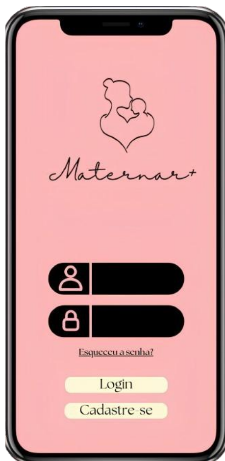
FIGURA 2: Tela inicial do app “Maternar+”

Conforme esta figura 2, ela representa a interface de acesso ao aplicativo Maternar+, com um design suave e receptivo, adequado ao público-alvo. Com um plano de fundo rosa suave, a tela expressa delicadeza e zelo, reforçando a ideia de um espaço seguro e acolhedor para as mães. No centro, existem dois campos fundamentais: um para o usuário e outro para a senha, ambos acompanhados por ícones de fácil compreensão que simplificam a digitação.