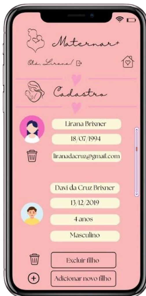
FIGURA 6: Tela com os dados da mãe e filhos

Nesta figura 6 podemos ver “Cadastro” do aplicativo exibindo informações dos usuários cadastrados de forma organizada e clara.