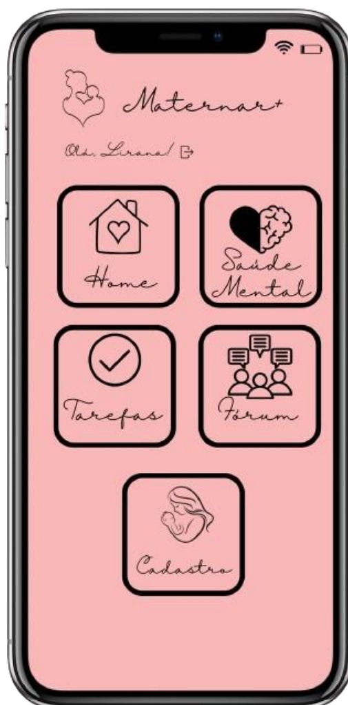
FIGURA 4: Menu principal do app “Maternar+”

A figura 4 representa o menu do aplicativo, distribuído por 5 sessões, onde cada uma representa uma funcionalidade. Abaixo do título “Maternar+” nota-se o nome da usuária que está utilizando o sistema, no caso do exemplo acima utilizei a mim mesma como usuária do aplicativo.