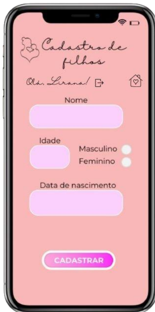
FIGURA 5: Tela de cadastro de filhos

Na figura 5 consta a tela de “Cadastro de filhos”, onde apresenta uma interface simples e acolhedora, com campos destacados em um tom rosa claro para facilitar a leitura.