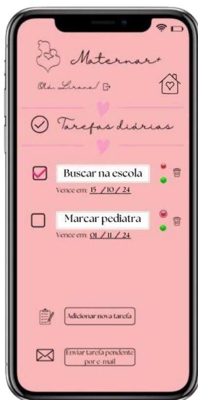
FIGURA 7: Tela de tarefas do aplicativo

Na parte de baixo da tela há dois ícones: uma lixeira e um “+”. O botão da lixeira oferece a opção de excluir o registro do filho cadastrado, podendo assim a mãe optar por qual cadastro excluir ou se possui somente uma criança cadastrada serão os dados dela que irão ser eliminados. Já no ícone “+” traz a opção de adicionar um novo filho, caso a mãe queira adicionar os dados de mais uma criança, voltando automaticamente para a tela da figura 5.