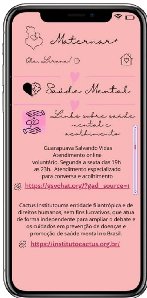
FIGURA 12: Tela “Links sobre saúde mental e acolhimento”

Esta figura 12 representa a tela onde estão disponíveis links de acolhimento e conversa e também sites que abordam o assunto “Saúde Mental”. Ao clicar no primeiro link " Guarapuava Salvando Vidas " abre um site de acolhimento onde a mãe que necessita de apoio e conversa terá um atendimento gratuito com voluntários que estão dispostos a conversar e ajudar.